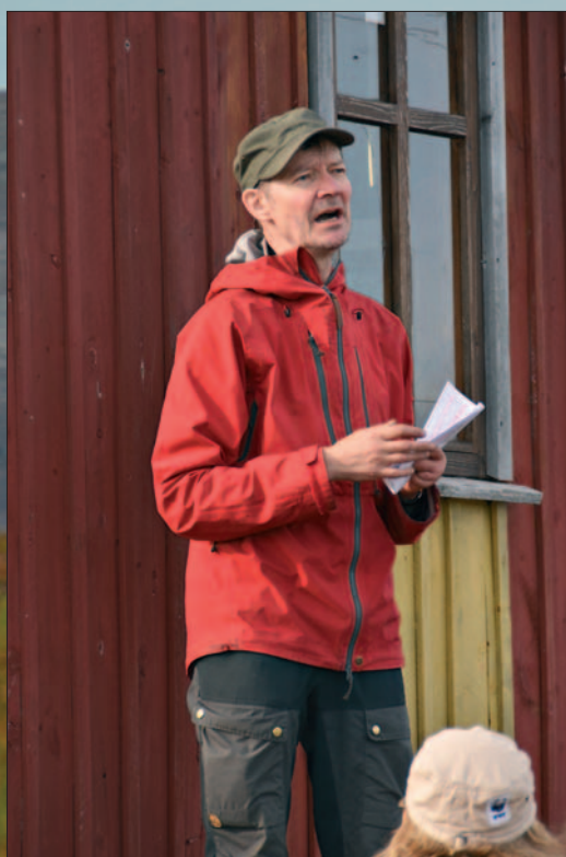
Juha Hurme luennoi Paulaharjusta Jäkäläpäällä.

Teatteriohjaaja-kirjailija Juha Hurme järjesti syyskuun puolivälissä yhteistyössä Lapin kirjallisuusseuran ja Lapin Kullankaivajain Liiton kanssa Samuli Paulaharju -luentosarjan Lemmenjoen kulta-alueen Jäkäläpään ja Martiniiskonpalon erämaakirjastoilla.