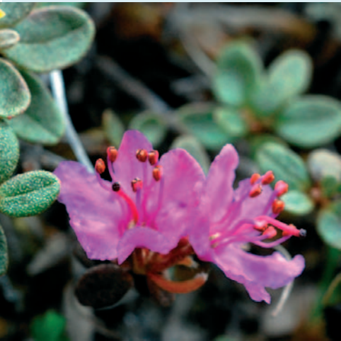
Korun esikuva, Lapinalppiruusu.