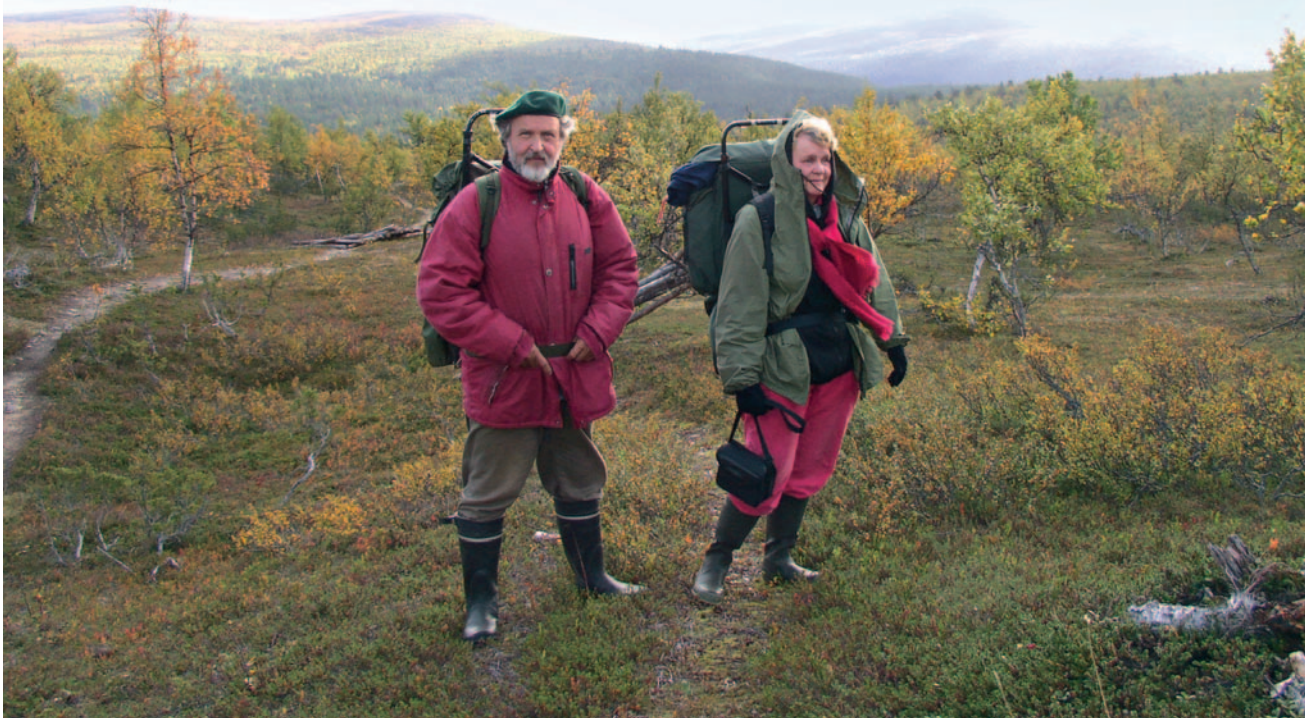
Alhoret tunturissa syksyllä 2004.