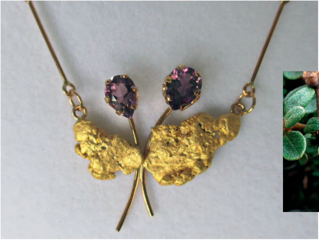
Aarne Alhosen koru "Rhododendron Lapponicum".