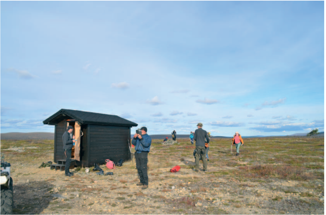
Kävelyjalkapallokentän valmistelu Martiniiskonpalolla.