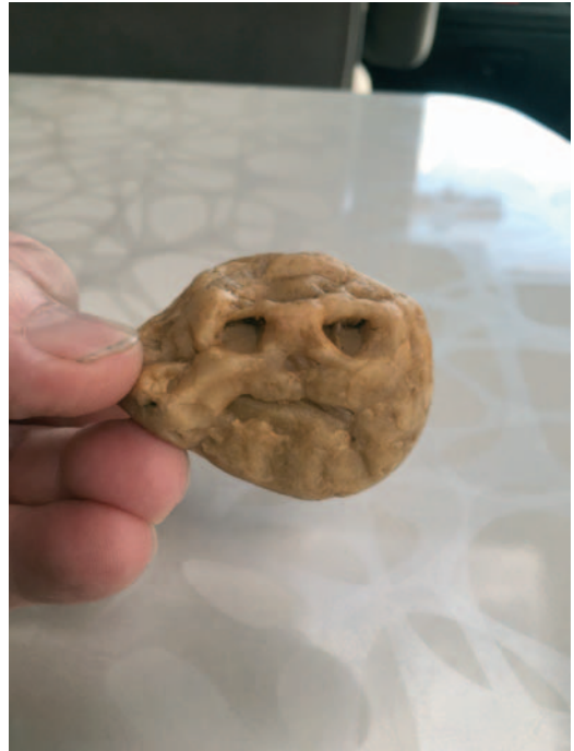
Muu maailmankaikkeus 3. sija: “Alien pääkallo”.

Tuomariston erityismaininnan saa Antti Paananen kuva “Platinahippu 2,89 g. Sotajoki 6.8.2024 imuroimalla”. Todella upea löytö!