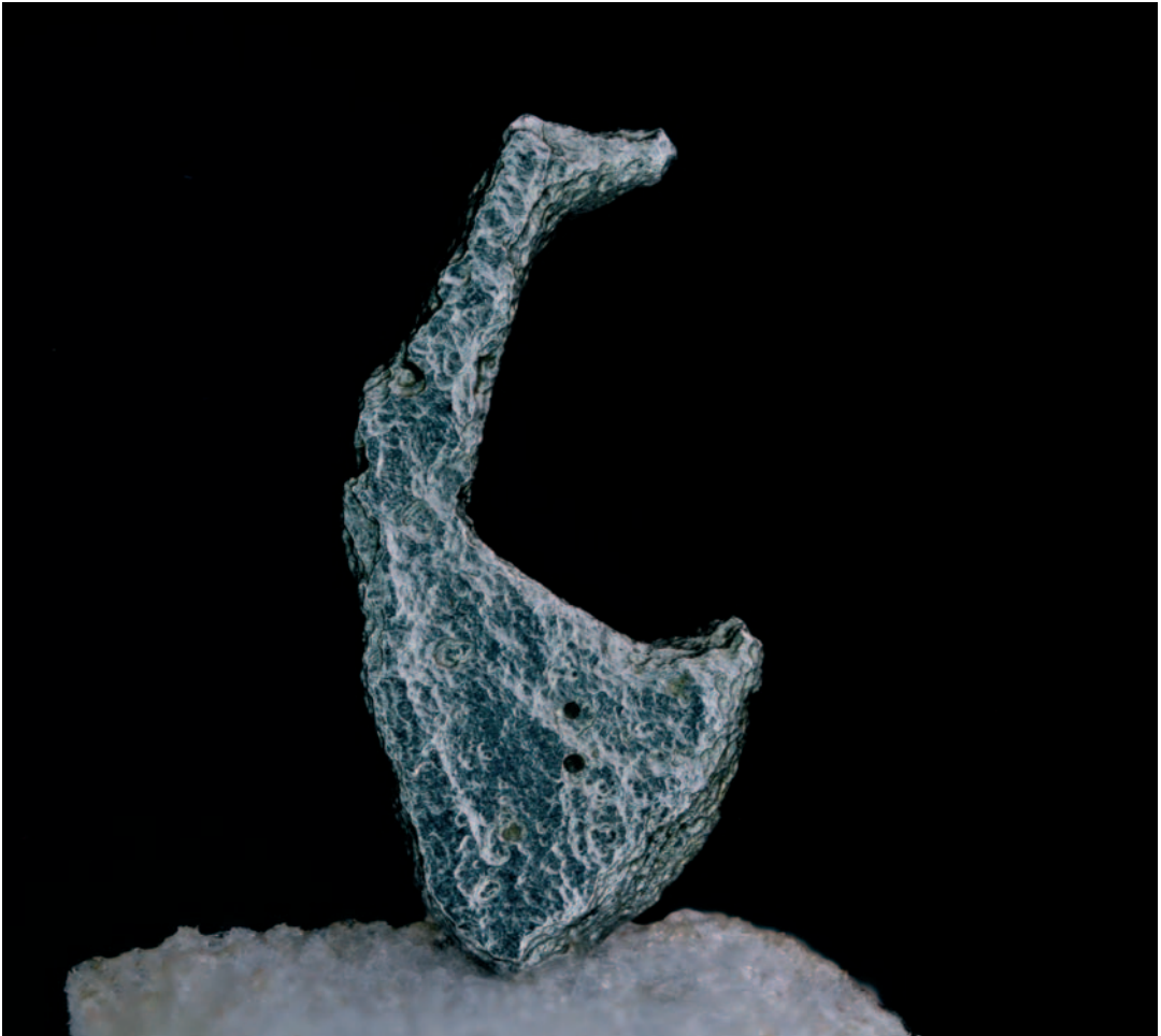
Muu maailmankaikkeus -sarjan toinen sija: “Kuutonen”.

Soukankaan kuvan taustatiedot eivät kerro kubistisen kuutosen muotoon jäähmettyneen platinaryhmän mineraalin nimeä eikä sukua,