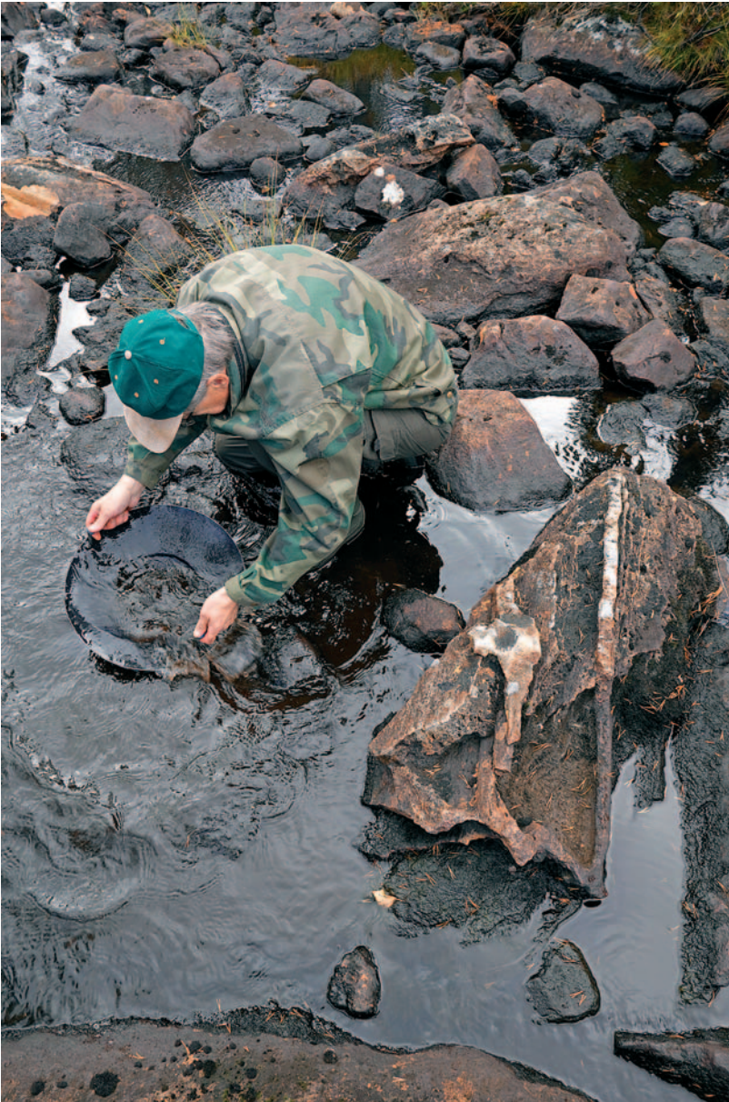
Työn kuva -sarjan voittaja: "Koehuuhdonta".

Ensi vilkaisulla kuvassa ei ole sitä suurta draamaa tai työn sankarilaulua, jota visuaalisesti näyttaviin kaivukuviin usein haetaan, mutta kuvan ääreen tarkemmin pysähtyessä siinä onkin lopulta kaikki. Koevaskauksen tai loppupesun hiljainen rituaali, jossa on lopulta läsnä enää itse kullankaivaja, kultapuro ja vaskoolin pohjalla kenties kauan kaivattu ja kauan kaivettu kulta.