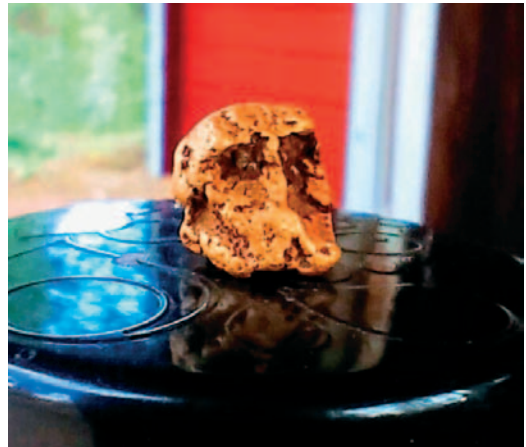
“Fantom, Ropedangerin huono enne”.

Kultakuvakisan tuomariston mielenterveyden ja ajankäytön hallinnan nimissä onkin varmaan syytä jatkossa rajata kuvien määrä per osallistuja per sarja johonkin mielenterveydellisesti hyväksyttävälle tasolle. Lisäksi jatkossa