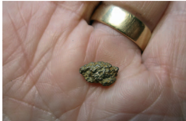
Erityismaininta kuvalle “Platinahippu 2,89 g. Sotajoki 6.8.2024 imuroimalla”.