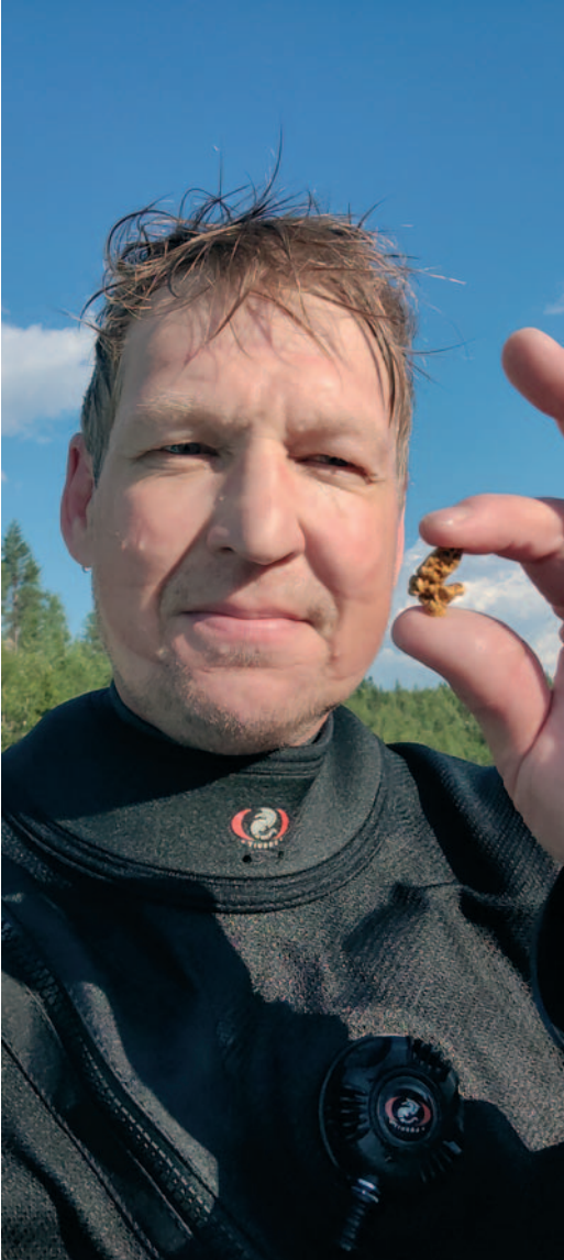
Kullan murut -sarjan kolmas sija: "Kostean tuore sukellettu imuroitu hippu Sotajoelta, 10,57 g".

Makrokuvauksella saa pieniinkin löytöihin näyttävyyttä, toteaa Parkkonen osuvasti.