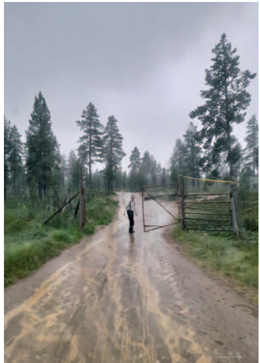
Sarjan Muu maailmankaikkeus voittajakuva on Palsintien poroportti.

Pille Piret Matalojan melankolinen tai jopa hieman mystinen kuva rankkasateen piiskaamalta Palsintien poroportilta voitti sarjan Muu maailmankaikkeus. Nimeämätön kuva voisi