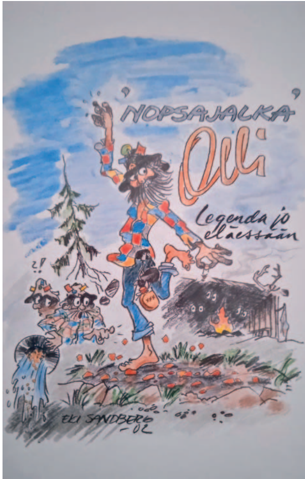
Piirros: Erkki Sandberg 2002.