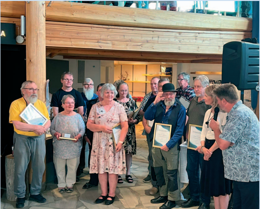
Ansioituneita kultakisatalkoolaisia vuosikymmenien varrelta muistettiin kunniakirjoin.

Kun kesällä tuli lisäksi täyteen 50 vuotta Lapin Kullankaivajain Liiton alulle panemien