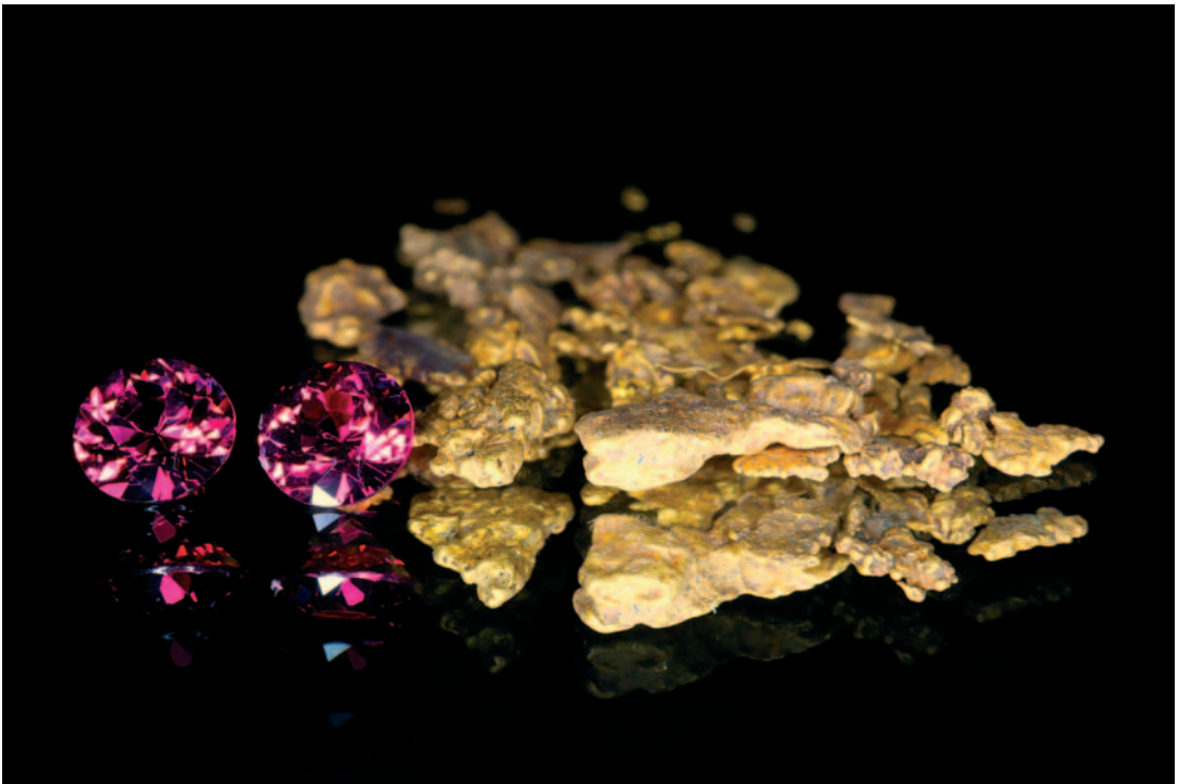
2. sija sarjassa Kullan murut: “Kivet ja kullat”, kaksi viistehiottua, halkaisijaltaan 3,5 mm granaattia ja noin kaksi grammaa Puskuojan kultaa. Kivien hionta: Kaarlo Säkkilä

Kuvaaja itse kertoo kuvassa olevan halkaisijaltaan 3,5 millimetrin kokoiset briljanttihiotut granaatit ja noin kaksi grammaa Puskuojalta huuhdottua kultaa. Kivien löytöpaikka ei ole enää tarkassa muistissa, mutta ne ovat todennäköisesti Martti Patjaksen ja Sampo Parkkosen aikanaan Puskuojalla kaivamia. Kivet hioi 80-luvun loppupuolella ivalolainen Kaarlo Säkkilä . Kuva on järjestelmäkameralla ja makro-objektiivilla kuvattu siten, että ki-