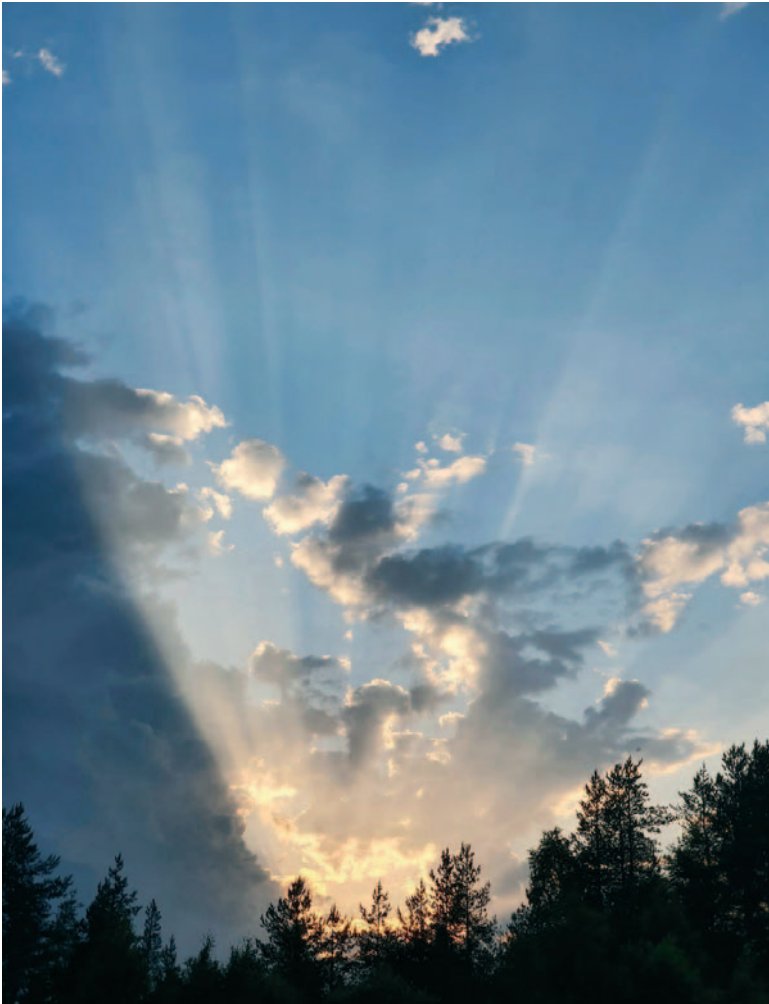
Kullankaivaja kotonaan -sarjan jaetut 3. sijat: "Kulta- reunapilvet kesäisessä yössä".