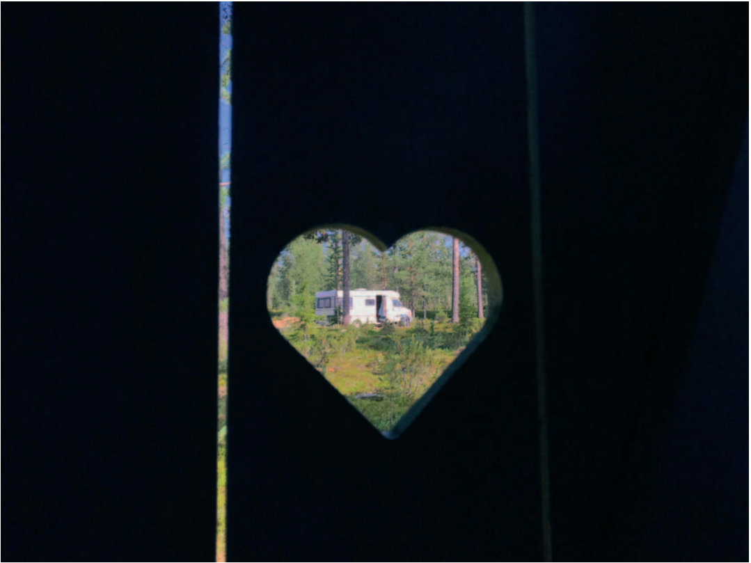
Kullankaivaja kotonaan -sarjan 2. sija: "IMG_4849" eli "Paskahuussi".

kaivajat ovat lähteneet kultaleiristä tutkimusretkelle. Maiseman avaruus tuntuu antavan tilaa sekä nuorten että katsojan mielikuvitukselle.