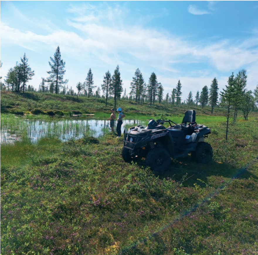
Kullankaivaja kotonaan - sarjan voittaja: "Tutkimusta Selperinojalla".

Hetken hengähdys ja huntaustauko yksinäisen uurastuksen keskellä, mukana ehkä pieni hiven epäilyä ja epäuskoa. Tiiviissä kuvassa on intensiivisesti läsnä paljon niistä tunnelmista, joita jokainen kullankaivaja montullaan kokee.