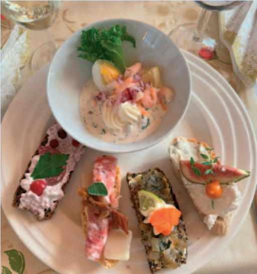
Juhlakattauksessa katkarapuskagen ja sormiruokana lihaa, kalaa, kasviksia ja hedelmiä.