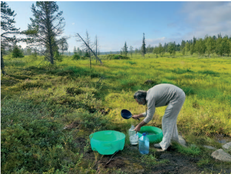
sekä "JeCo 13".